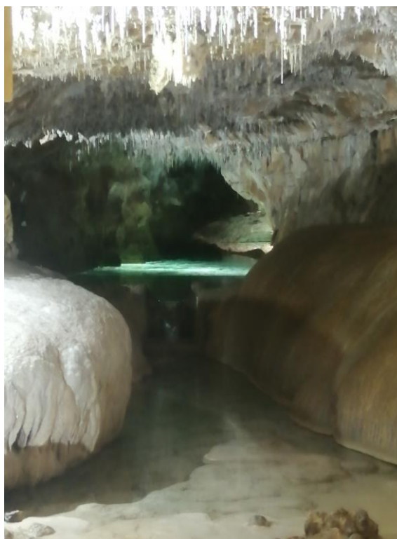
En direction du col Vert et grottes de Choranche